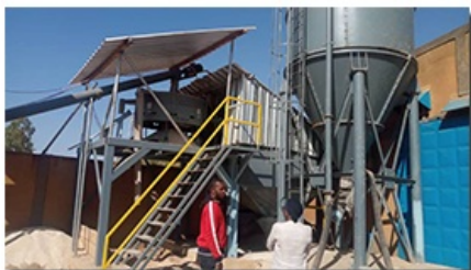
Visite d'une unité industrielle en construction

Elle a également pour rôle d'assister les investisseurs dans le processus de mise en œuvre de leurs projets à travers un accompagnement pour l'accomplissement des formalités administratives et la facilitation du dialogue entre les acteurs des secteurs privé et public intervenant dans le processus de réalisation des investissements.