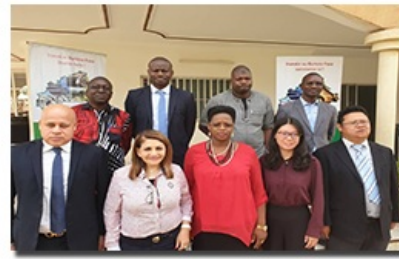
Le géant Chinois SINOSURE présente ses projets d'investissements au Burkina Faso à l'ABI