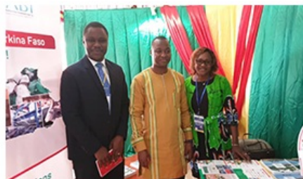
L'ABI à la Semaine des activités Minières de l'Afrique de l'Ouest (SAMA O)