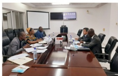
Séance de travail avec le JETRO (Organisation Japonaise du commerce extérieur) à l'ABI

En outre, l'ABI favorise le développement de partenariats de co-investissements à travers sa banque de projets dans laquelle sont enregistrés les projets publics et ceux portés par des promoteurs nationaux en quête de financement et/ou de partenaires. Ces projets sont promus partout dans le monde à travers notre site web mais également lors de nos missions de promotion à l'étranger au cours desquelles nous organisons des « Focus Burkina Faso » à l'attention des investisseurs des pays hôtes ou des rencontres de présentation des opportunités et climat des affaires dénommées « B 50 » à l'attention de la diaspora sur place.