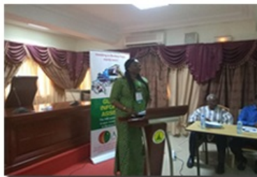
intervention de la représentante des conseillers économiques