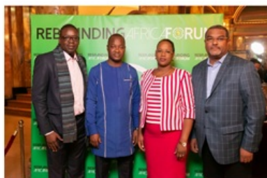
L'ABI au Rebranding Africa Forum 2019