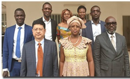
Fin de séance de travail avec le groupe SUMEC et leur partenaire local Alioth Système energy sur l'implantation d'une centrale électrique de 200MW