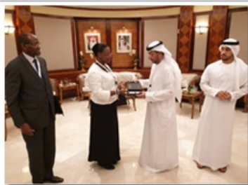
Rencontre avec le Vice Ministre en charge de l'investissement Emirati