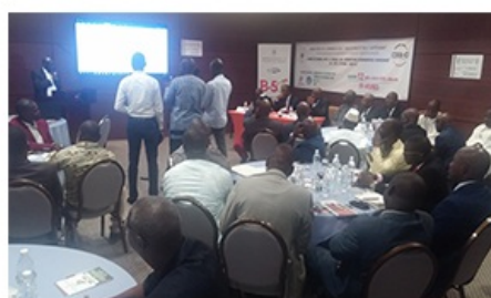
Rencontre d'information sur les opportunités d'investissement au Burkina Faso avec la diaspora en Côte d'Ivoire