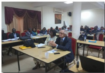
Les conseillers économiques en formation

Ce portail est non seulement un espace digital collaboratif avec les représentations diplomatiques du pays à l'étranger mais aussi de diffusion des potentialités économiques et commerciales du Burkina Faso.