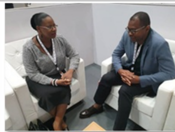
Echanges entre DG ABI et DG API Niger